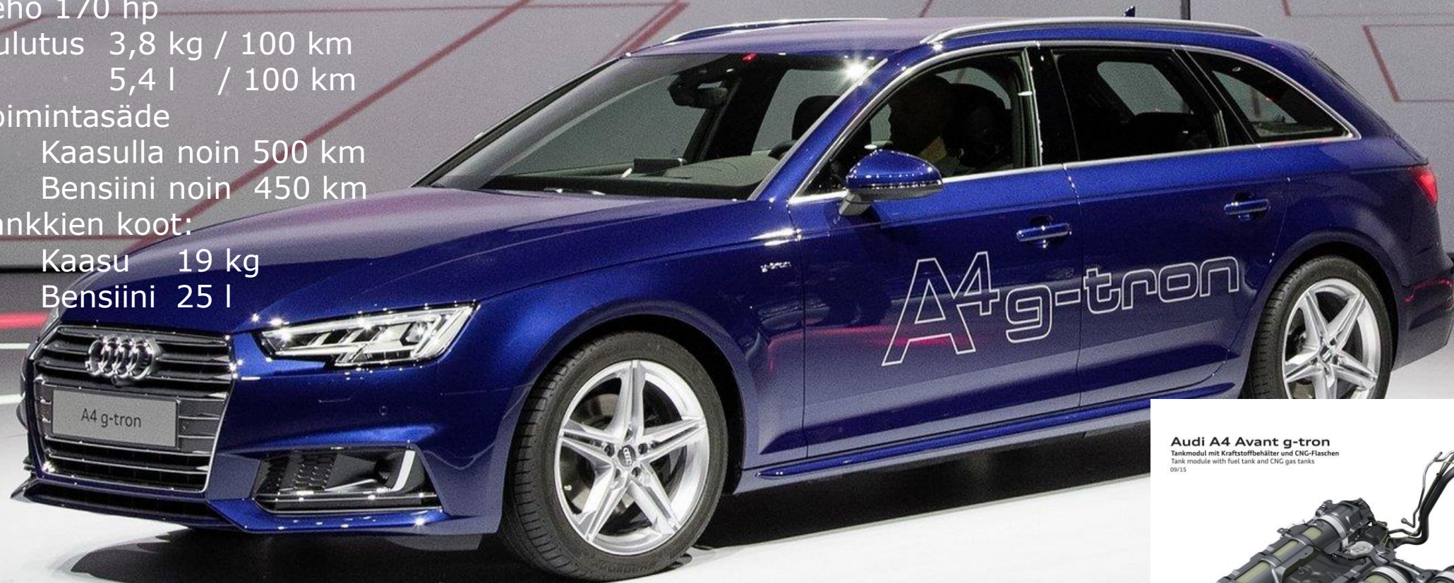
Audi A4 Avant g-tron

Tankmodul mit Kraftstoffbehälter und CNG-Flaschen Tank module with fuel tank and CNG gas tanks